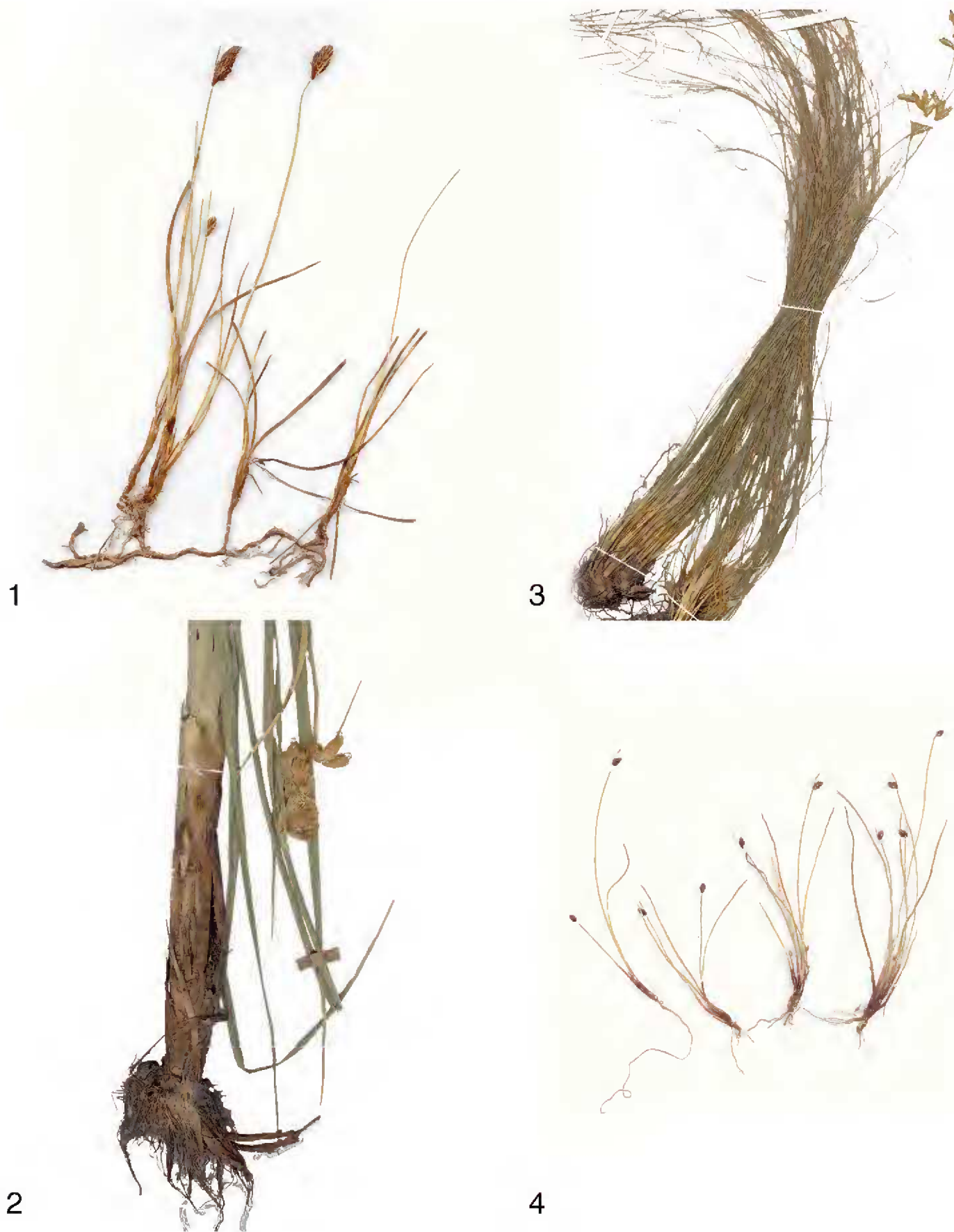
Figs. 1-4. 1. Amphiscirpus nevadensis (S. Watson) Oteng-Yeb. S. González 1010 (CIIDIR). 2. Bolboschoenus maritimus ssp. paludosus (A. Nelson) T. Koyama. Inflorescencia y porción de tallo y hojas, S. Zamudio 11360 y S. González (CIIDIR). 3. Cypringlea coahuilensis (Svenson) M.T. Strong. Inflorescencia y porción de tallo y hojas, Hno. E. Lyonnet 3933 (MEXU). 4. Isolepis cernua (Vahl) Roem. & Schult. Ejemplar, R.F. Thorne et al. 58187 (CIIDIR).